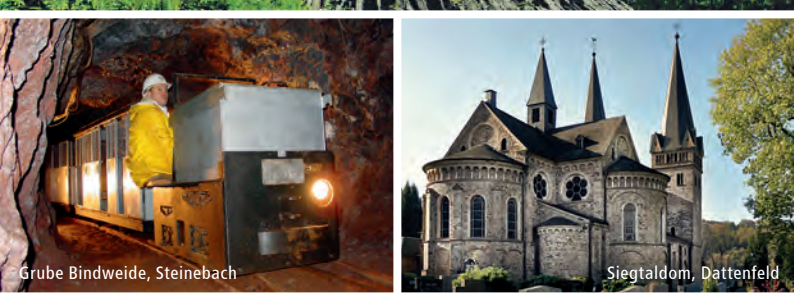
Grube Bindweide, Steinebach