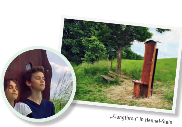
„Klangthron“ in Henkel-Stein

Buchen Sie Ihre Unterkunft über unsere Website www.naturregion-siegl.de und erhalten Sie für den gesamten Aufenthalt ein kostenloses Ticket für den Verkehrsverbund Rhein-Siegl! Damit können Sie vom An- bis zum Abreisetag umsonst mit Bus, S-Bahn oder Zug in der gesamten Naturregion Siegl und zwischen Düren im Westen, Solingen im Norden, Olpe im Osten und Neuwied im Süden fahren.