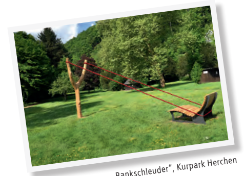
„Bankschleuder“, Kurpark Herchen

An Aussichtspunkten finden Sie Panoramatafeln, durch die Sie räumliche Zusammenhänge und Wegverläufe erkennen. Und wie war's zum Abschluss mit einem originellen Erinnerungsfoto auf der „Bankschleuder“ im Kurpark Herchen?