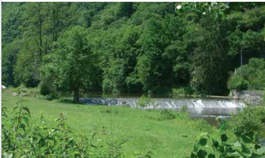
Nisterwehr bei Hahnhof

Die Stadt Wissen nimmt ihre Entwicklungschancen durch eine nachhaltige und zukunftsorientierte Flächenvorsorge aktiv wahr. Dabei koordiniert die städtische Gesamtplanung den Bedarf an Wohnbau-, Schul-, Sport- und Gewerbeflächen und sichert die Ansprüche der Land- und Forstwirtschaft sowie von Natur- und Landschaftsschutz.