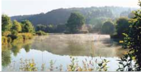
Teichanlage im Frankenthal