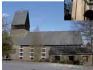
Kath. Kirche „St. Katharina“ Schönstein