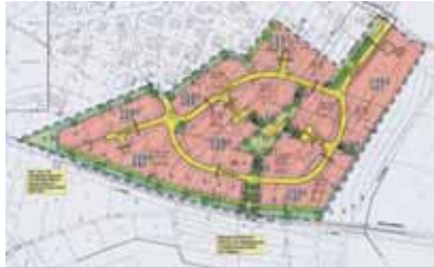
Bebauungsplan „Auf den Weiden“