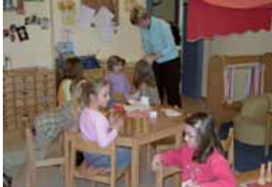
Städtische Kindertagesstätte „Villa Kunterbunt“