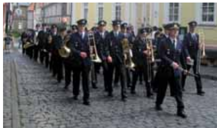
Stadt- und Feuerwehrkapelle Wissen

Unsere Vereine und Organisationen sind sich ihrer gesellschaftlich wichtigen Aufgabe voll bewusst. Die Stärkung des Ehrenamtes hat es ermöglicht, neue Angebote – insbesondere für Jugendliche – in die Vereinsprogramme aufzunehmen.