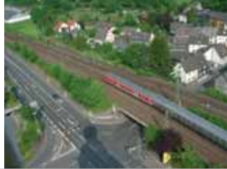
Bahnparallelle (B 62)/ Bahnlinie Köln-Siegen