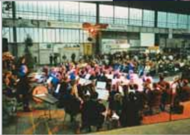
Eröffnungsveranstaltung der Music- und Theatertage 2002 mit der Band „Street Life“ und der Stadt- und Feuerwehrkapelle Wissen