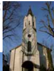
Ev. Erlöser-Kirche Wissen

Die Familien werden durch den hohen Bestand an Kindergärten, Tagesstätten und anderen Einrichtungen in ihren Erziehungsaufgaben wirkungsvoll unterstützt.