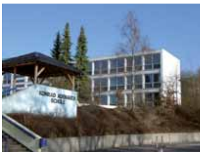
Hauptschule – Konrad-Adenauer-Schule

Regelmäßige, gemeinsame Projekte von Stadt und Schulen vertiefen das Interesse der Jugendlichen für kommunale Fragestellungen und stärken die Verbindung zwischen der Stadt und ihren Jugendlichen.