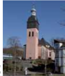
Kath. Pfarrkirche „Kreuzerhöhung“ Wissen